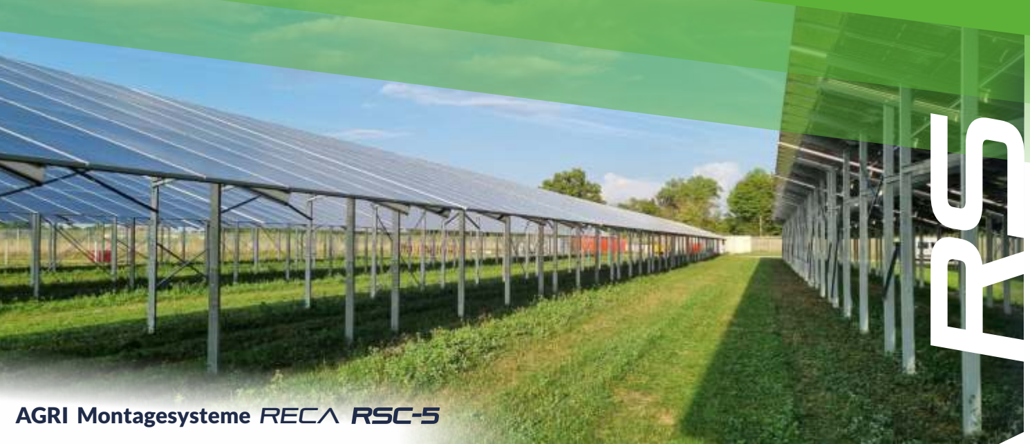
AGRI Montagesysteme RECA RSC-5