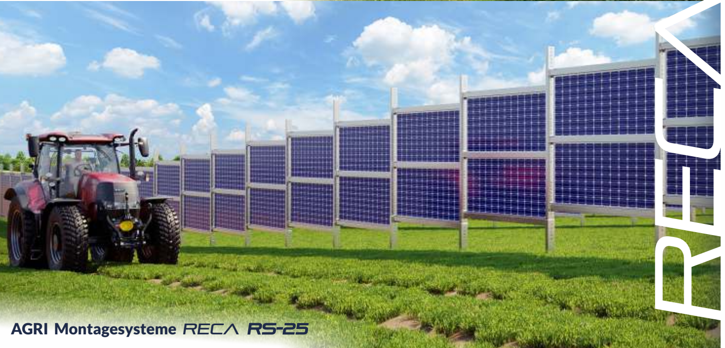
AGRI Montagesysteme RECA RS-25